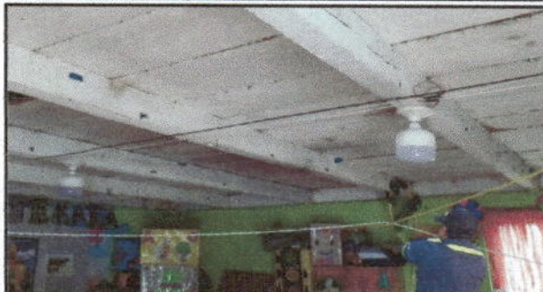
Foto 7: se muestra la instalación de las plafoneras en todos los módulos.