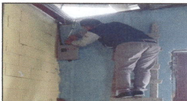
Foto 10: Se muestra la instalación de los tableros de los filpones.