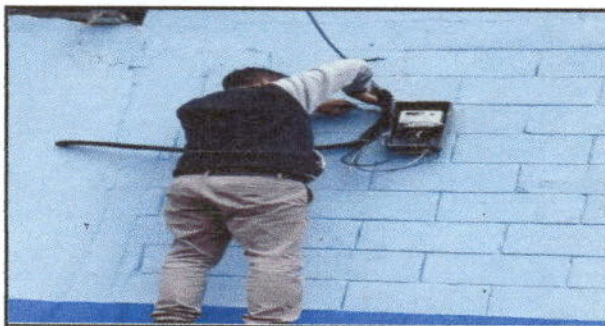
Foto 11: Se muestra la colocación del cableado eléctrico, iniciando desde la conexión principal con el contador hasta cada uno de los módulos.

Observación: Si es necesario se pueden agregar hojas adicionales y actualizar el número de hojas.